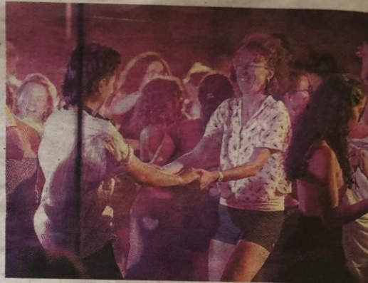
On vous attend sur le dancefloor.